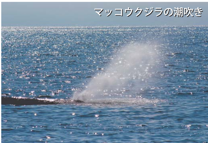
マッコウクジラの潮吹き