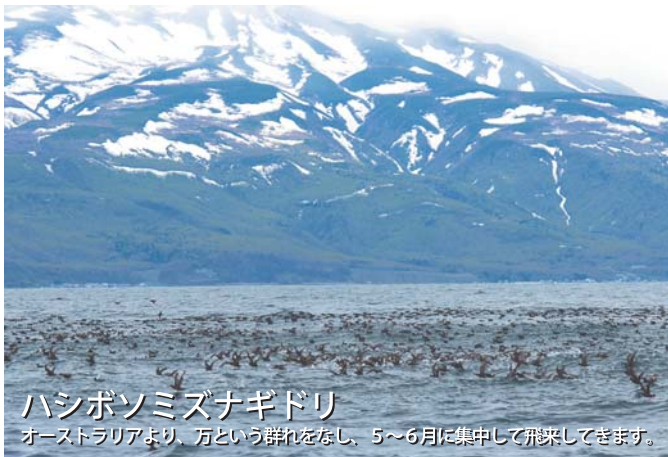
ハシボソミズナギドリ

知床は野生動物の宝庫。その類希な生態系は、たくさんの動物達の住処となっています。当社では世界遺産知床の羅臼から、海の動物達の探索と動物たちの営みをご案内します。海上でマッコウクジラやシャチとイルカ、そしてたくさんの希少な野鳥たちとの出会いと感動があります。世界遺産知床の海を大型クルーザーでクジラとイルカを見に行こう。春は、知床連山をバックに海で戯れるシャチやイルカ。そして夏は、クライマックスのマッコウクジラのフルクアッパを真近で見よう。