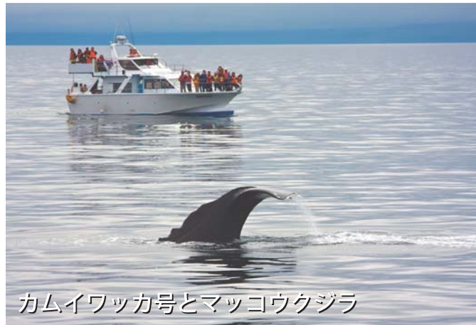
カムイワッカ号とマッコウクジラ