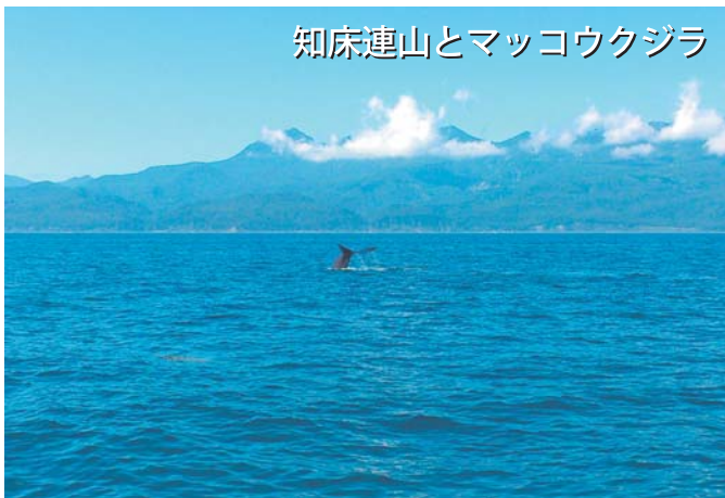
知床連山とマッコウクジラ